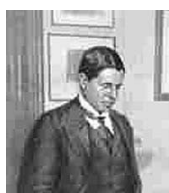
Albéric Magnard 1865-1914