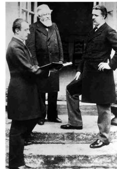
Charles Bordes Alexandre Guilmant et Vincent d'Indy